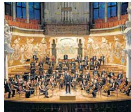
L'Orquestra Simfònica del Vallès acosta la música al cinema, el teatre i la literatura.