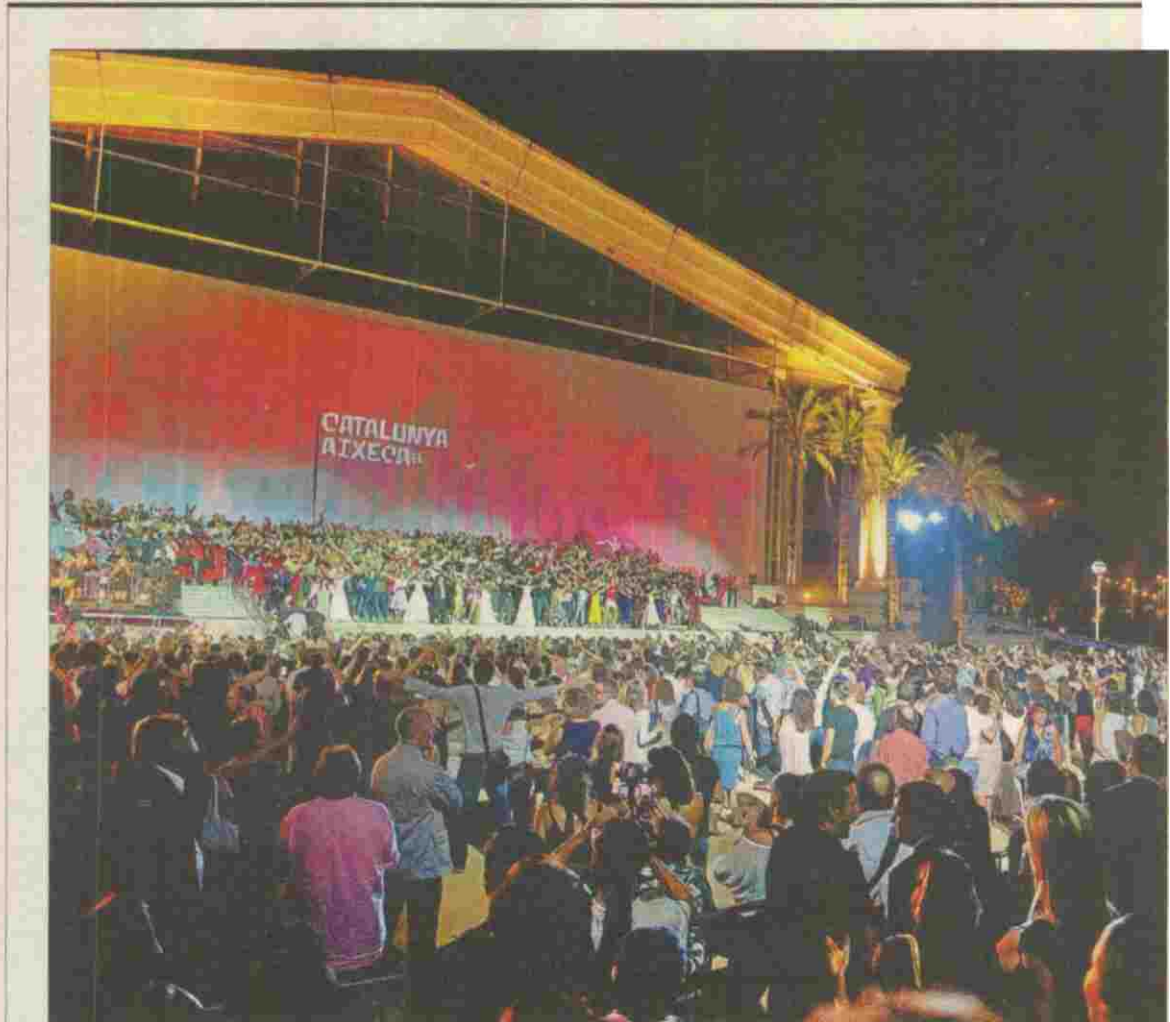
Un moment de la gala d'ahir a la nit als jardins del TNC

L'altra dada negativa ha estat la caiguda d'espectadors de dan-